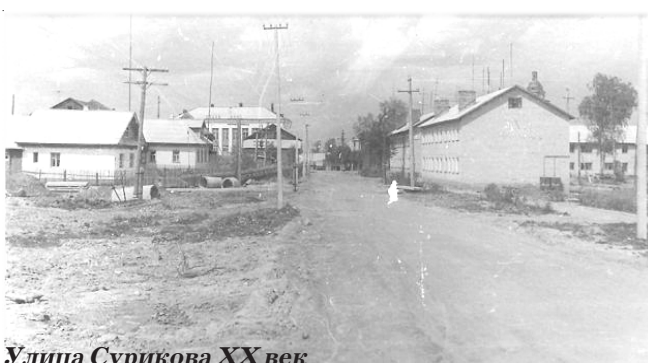
Улица Сурикова XX век