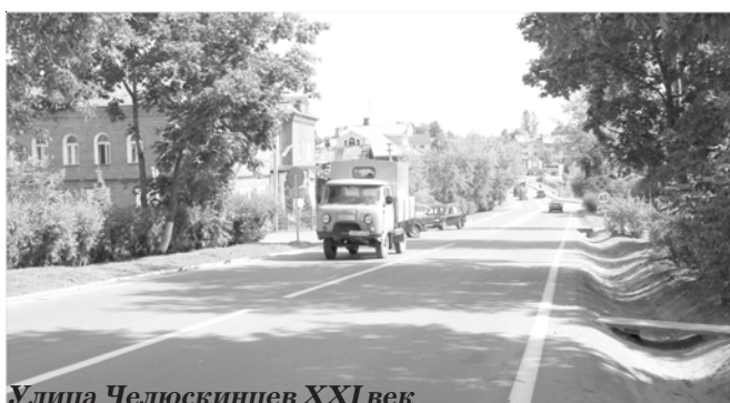
Улица Челюскинцев XXI век