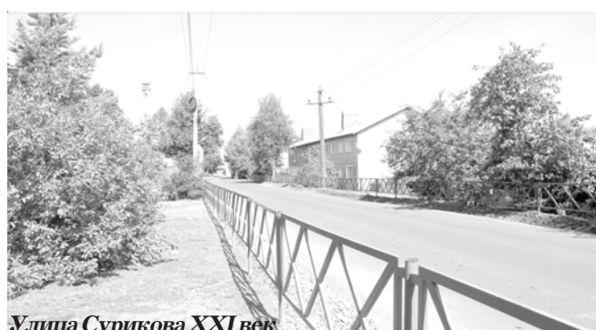
Улица Сурикова XXI век

Задачу создания такого института в России поставил Президент РФ Владимир Путин.